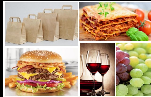
Plan officiel des commerçants